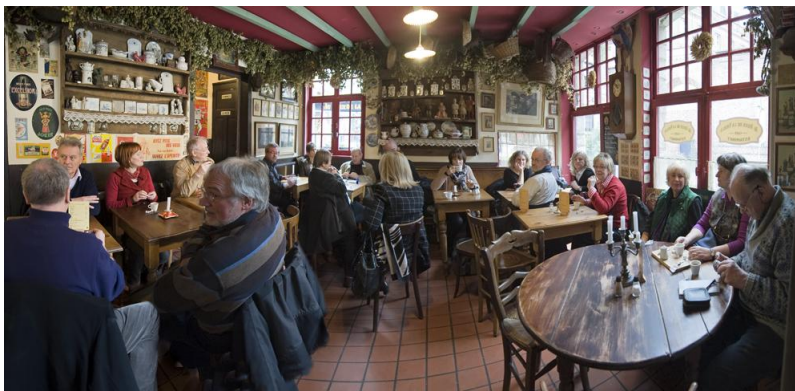
Im „Au Vieux de la Vielle“

Selbstverständlich kommen auch hier die leiblichen Genüsse nicht zu kurz. Der AIV lädt zur Pause in ein gemütliches Café-Estaminet ein.