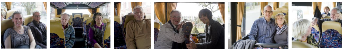
Les Commères – Die Klatschbasen