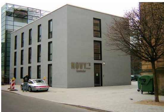
(Eröffnung Museum 28.08.09!)

Unser diesjähriges Spargelessen am 17. Juni 2009 im Novy's war ein voller Erfolg!